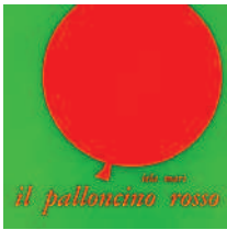
IL PALLONCINO ROSSO di Iela Mari, Babalibri, 2004

Il racconto delle avventure di un palloncino rosso che pagina dopo pagina si trasforma in una mela, in una farfalla, in un fiore, in un ombrello in un infinito susseguirsi di sorprese. Un libro che ha rivoluzionato la letteratura per l'infanzia italiana. Con questo silent book Iela Mari dedica una serie di ricerche e di studi ai bambini. I suoi sforzi sono atti a trovare un "linguaggio per immagini" adatto all'età prescolare che si esemplificano nei suoi libri. Si tratta di libri innovativi, libri circolari, senza inizio e senza fine, che raccontano il susseguirsi di varie fasi della vita animale e vegetale nelle sue forme più semplici e accessibili ai più piccoli. Età di lettura: da 3 anni.