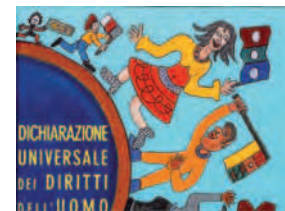
DICHIARAZIONE UNIVERSALE DEI DIRITTI DELL'UOMO di Willam Wilson Giannino Stoppini Edizioni, 1998

Questo splendido albo illustrato celebra nel migliore dei modi la ricorrenza, della dichiarazione universale dei diritti dell'uomo, attraverso le immagini di un grande pittore che, di madre francese e padre africano, mescola sapientemente le tradizioni visive delle due culture. Con i suoi pastelli che ricordano insieme le matite della scuola e l'ocra delle sue terre, riesce a raccontare ai bambini di tutte le età i diritti che nessuno ci può negare, e le fondamenta di ogni vero vivere civile. Libro splendido da mostrare con estrema attenzione e da discutere pagina dopo pagina insieme con i vostri bambini, avviando così un'abitudine al dialogo e al confronto tra piccoli e grandi che dovrebbe diventare una consuetudine quotidiana. Età di lettura: per tutti