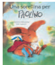
UNA SORELLINA PER PAOLINO di Brigitte Weninger, Illustratore: Ève Tharlet Nord-Sud Edizioni, 2007

Presto mamma coniglio avrà un piccolo e tutti sono felici... Tutti tranne Paolino. Il suo amico Robi l'ha avvertito: i neonati sono una vera catastrofe e Paolino, a dire il vero, preferirebbe avere un criceto, piuttosto che un bebè. Ma, quando nasce la sorellina, cambia tutto... Una storia piena di umorismo e tenerezza che parla dei dubbi e delle paure di tutti i bambini, quando a casa arriva un fratellino. Età di lettura: da 3 anni.