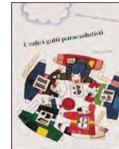
UNDICI GATTI PARACADUTISTI di Matteo Terzaghi, Marco Zürcher Edizioni AER, 1997

Un aereo decolla ed ecco piovere dal cielo una squadra di gatti paracadutisti. A terra c'è un piccolo pubblico di bambini che si gode lo spettacolo, pronto a riceverli festosamente. Ma non atterreranno tutti insieme. Il vento li ha sparpagliati. Ognuno vivrà quindi un'avventura insolita e particolare, diversa dalle altre. In questa storia ci sono anche dei pesci, dei topi, degli uccelli, un asino, un coniglio, un campo di girasoli, un albero di ciliegie, un uomo baffuto, una signora con un cappello rosa e un gelataio... E ci sono anche molti dettagli che, fungendo da anticipi e da rimandi tra le varie scene del libro, invitano il lettore ad aguzzare la vista e a scoprire, come in un gioco, le connessioni "nascoste". Età di lettura: da 4 anni.