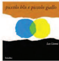
PICCOLO BLU E PICCOLO GIALLO di Leo Lionni, Babalibri, 1999

Piccolo blu e piccolo giallo adorano giocare insieme. Ma quando si abbracciano diventano verdi. Un classico della letteratura dell'infanzia. Leo Lionni, tra i più innovativi maestri dell'illustrazione per l'infanzia del secolo scorso, affronta con estrema delicatezza e forza poetica questo classico tema, individuandone tutte le sfumature possibili: identità, diversità, ingenuità, condivisione, libertà, multiculturalità. E raggiunge l'obiettivo ricorrendo a una coppia di protagonisti che non è né casuale né tantomeno usuale. Piccolo blu e Piccolo giallo non hanno occhi, né naso, né bocca, sono pure macchie di colore blu e giallo, eppure riescono a raccontarsi così bene da arrivare a noi lettori nella loro verità più intima. Per i bambini l'amicizia è un valore importante, quasi una prima forma d'innamoramento che provano verso l'Altro. Età di lettura: da 3 anni.