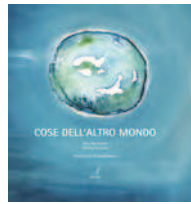
COSE DELL'ALTRO MONDO di Elisa Montanarice Daniela Tomasini

Un giorno la piccola Terra decide di mettersi in viaggio. Sarà un'avventura fantastica e ricca di incontri che aiuteranno la nostra protagonista a trovare delle risposte, ma, soprattutto, a riconoscersi nell'incontro e nella relazione con l'altro. Una storia nata per dare voce ai pensieri e alle emozioni dei bambini e che apre a tanti scenari educativi. Una storia che ha tanto da insegnare anche a noi adulti. Che aspettiamo, dunque, a salire a bordo anche noi per un viaggio verso pianeti strani e lontani? Chissà che non capiti di sentirci a casa... Età di lettura: da 4 anni.