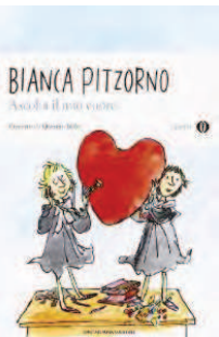
ASCOLTA IL MIO CUORE di Bianca Pitzorno Mondadori, 2010

Quando la nuova maestra viene soprannominata Arpia Sferza e quando ogni giorno di scuola si trasforma in una battaglia, potete ben credere che in IV D ne succedono davvero di tutti i colori. Tra scheletri da rimontare e motociclette, generali austriaci e fantasmi in cornice, lettrici di fotromanzi e pantere di velluto, tre eroine come Elisa, Prisca, Rosalba condurranno la loro lotta contro l'ingiustizia, a costo di aspettare che la vittoria arrivi lenta ma inesorabile come una tartaruga. Il bello di questo libro è che, a ogni età lo si legga, riserva delle sorprese. Ai bambini piacerà perché le protagoniste e le loro avventure sono irresistibili. Per i grandi, invece, sarà interessante scoprire la vita del dopo guerra, e realizzare quanto - o quanto poco - siano cambiate le cose da allora. Età di lettura: da 11 anni.