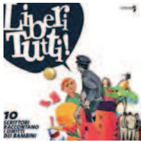
LIBERI TUTTI! di A.A.V.V. editore Comma 22