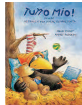
TUTTO MIO! , ovvero 10 trucchi per avere sempre tutto di Moost, Edizioni AER, 2011

Questo bellissimo libro racconta la storia di un piccolo corvo che, siccome voleva avere tutto per sé, portava nel suo nido giocattoli, libri, tricicli, ecc. appartenenti agli animali della foresta (agnello, lupo, scoiattolo, tasso orso). Ma alla fine resterà solo. Età di lettura: da 5 anni.